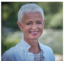
Brigitte KLINKERT (Haut-Rhin)