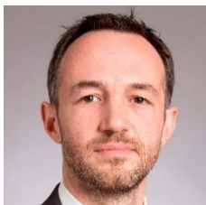
Emmanuel GRÉGOIRE (Paris) Premier adjoint à la Maire de Paris