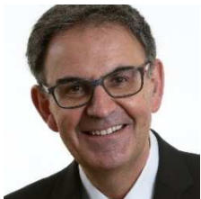
David KIMELFELD (Métropole de Lyon)