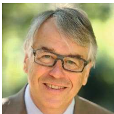
Jean-René LECERF (Nord) Président de la Commission des Finances locales