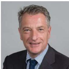
Hervé GAYMARD (Savoie)