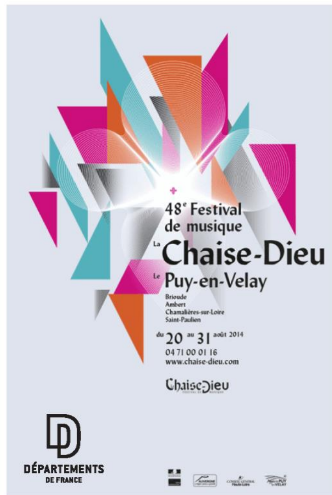
PARTENARIAT ÉVÉNEMENTS CULTURELS